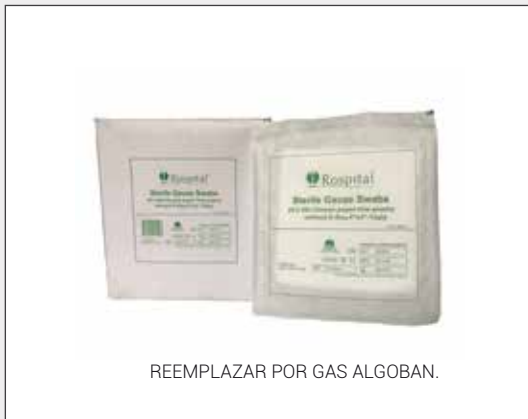
REEMPLAZAR POR GAS ALGOBAN.